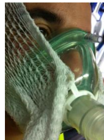
Fotos del Manual de Estabilización Inicial y Transporte Pediátrico y Neonatal